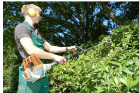
Gehölz- und Heckenschnitt