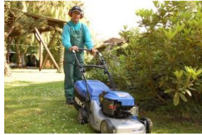
Rasenpflege mit Handmaschinen