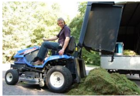
Grundstückspflege von Großflächen und extensiv genutzte Flächen