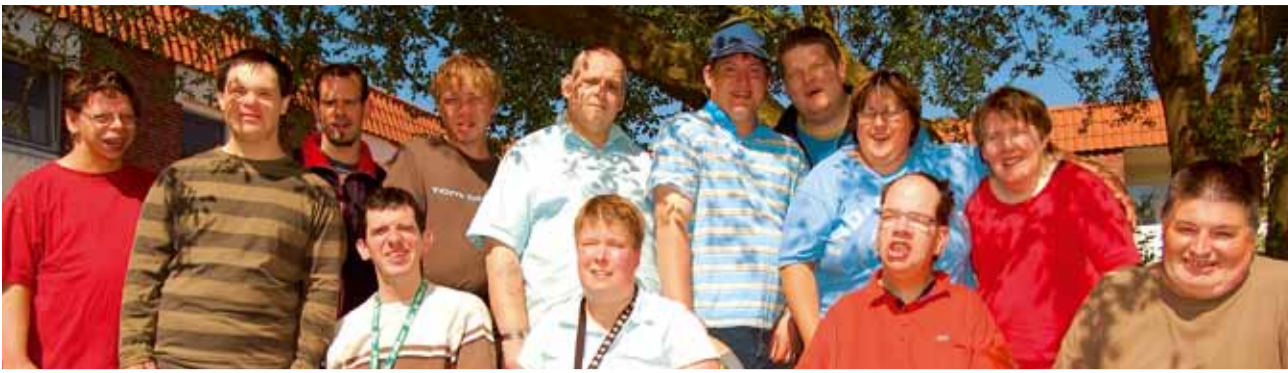
Dies sind die neu gewählten Heimbeiräte. Sie sind im Einzelnen in der Symbolbeilage aufgeführt.