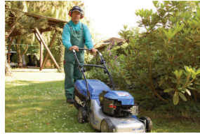
Rasenpflege mit Handmaschinen