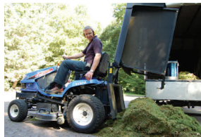
Grundstückspflege von Großflächen und extensiv genutzten Flächen